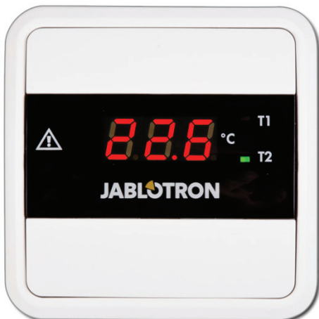
Obrázek 1: Přední pohled

Elektronický teploměr TM-201 lze využít ve všech instalacích, kde je potřeba měřit a zobrazovat jednu až dvě teploty. Tyto teploty jsou zobrazovány na přehledném displeji, kde je pomocí zelených LED zároveň indikováno, ze kterého teplotního snímače je aktuálně zobrazovaná teplota.