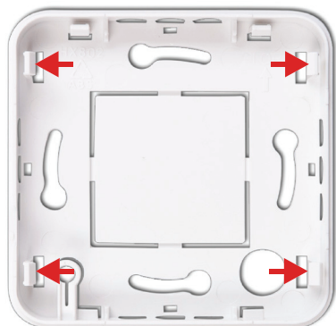
Obrázek 2: Spodní kryt